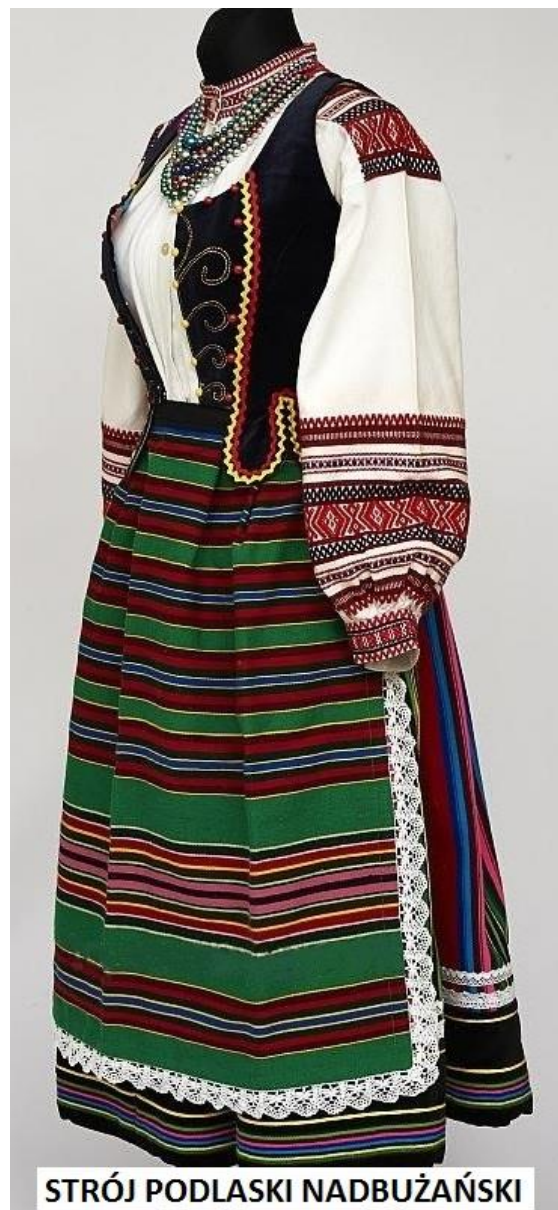
STRÓJ PODLASKI NADBUŻAŃSKI