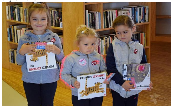
FOTO: Wyprawki czytelnicze w ramach akcji „Mała książka -Wielki człowiek”

Za każdą wizytę zakończoną wypożyczeniem minimum jednej książki, Mały Czytelnik otrzymał naklejkę, a po zebraniu dziesięciu został uhonorowany imiennym dyplomem. W Wyprawce znalazła się także broszura „Książka połączeni, czyli o roli czytania w życiu dziecka”, przypominająca o korzyściach wynikających z czytania dzieciom oraz podpowiadająca, skąd czerpać nowe inspiracje czytelnicze.