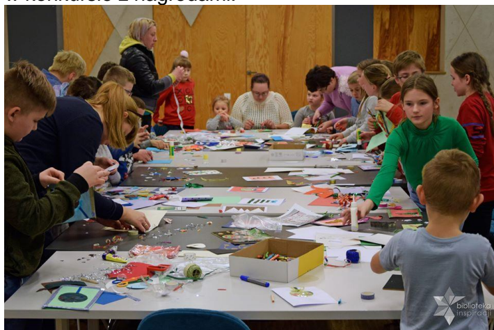
FOTO: warsztaty tworzenia kartek świątecznych

Dwa razy w okresie przedświątecznym (w kwietniu i w grudniu) miały miejsce warsztaty plastyczne tworzenia kartek świątecznych dla dzieci z obydwu szkół, a wykonane prace wzięły udział w konkursie z nagrodami.