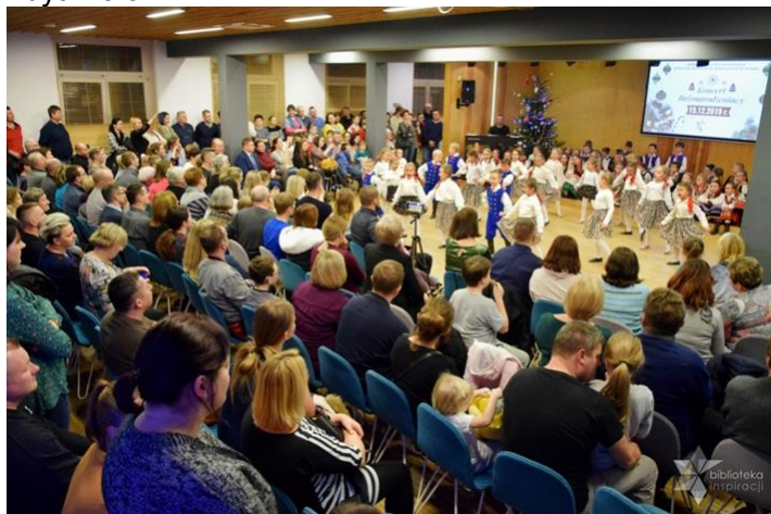
FOTO: Koncert Bożonarodzeniowy

W grudniowy wieczór odbył się „Koncert Bożonarodzeniowy”. Przedświąteczne wydarzenie zgromadziło tak wielu wykonawców i słuchaczy, że największa przestrzeń biblioteki okazała się dla nich zbyt mała.