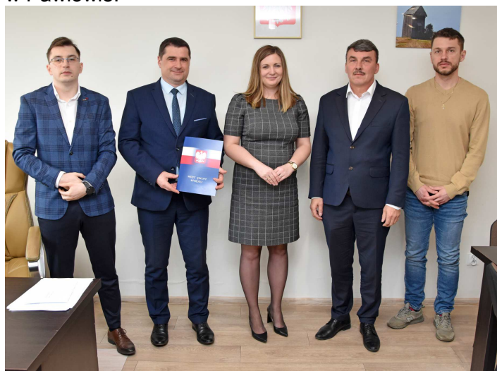
Foto. Podpisanie umowy z firmą PREF-BET

W ramach tego zadania do końca 2023 roku zostanie przebudowana droga Ignaców – Horostyta o długości 2280 metrów, droga w Adampolu (tzw Kolonia) na odcinku 820 metrów, Wyrkach – Adampol (tzw Małoziemce) o długości 690 metrów, Kaplonosach (tzw ferma) – 250 metrów oraz 3 odcinki dróg w Wyrkach – Połud na długości około 800 metrów. W sumie oznacza to blisko 5 km nowych dróg gminnych o nawierzchni asfaltowej. Wykonawcą zadania została firma PREF-BET Wytwórnia Mas Bitumicznych, Betonu i Prefabrykatów Sp z o.o. w Pawłowie.