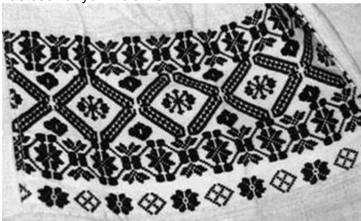
Perebor naramienny – element ozdobny na damskiej koszuli

Historia tkactwa sięga okresu neolitu. Od tamtego czasu zaszło wiele zmian w technice tkania, rodzajach narzędzi tkackich i surowców. W okresie największego rozwoju tkactwa na Podlasiu i Polesiu, czyli w XVIII i XIX wieku, tkano zarówno w tkackich manufakturach, jak i powszechnie w wiejskich chatkach. Wyrabiano takie tkaniny jak: płótna, pasiaki, krajki, kraciaki z przeznaczeniem na odzież, bieliznę, obrusy, pościel, płachty i worki. W XIX wieku pojawiły się tkaniny przetykane, posiadające ornament w kolorze odmiennym od tła, powstający poprzez przewlekanie dodatkowego wątku na tle utworzonym splotem płóciennym. Tylko nieliczne tkaczki posiadały umiejętność tkania ornamentów i komponowania wzorów. Bogactwo ornamentów tworzonych na tkaninach przetykanych uzależnione jest od liczby zastosowanych nicielnic.