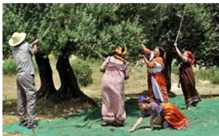
fot. Zbieranie oliwek

Olej oliwkowy wykorzystywany jest tam na różne sposoby, głównie kulinarny – jako składnik do przygotowania różnych potraw a bardzo często do bezpośredniego spożycia z chlebem. Medyczny – jako środek leczniczy w kaszlu i infekcjach dróg oddechowych, a także do wcierania w skórę na różne bóle i kosmetyczny – do stosowania na skórę i włosy. Olej z oliwek od wieków był przedmiotem sprzedaży i wymiany towarowej. Zarówno dawniej, ale i obecnie pożądanym prezentem często ofiarowanym gościom, a mieszkańcy miast odwiedzając Kabilskie wsie opuszczają je z bagażem pełnym oliwy z oliwek