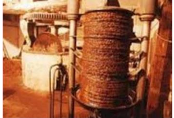
fot. Tłocznia oliwy

Oliwkową pastę pakuje się do nylonowych kręgów i układa warstwami. Następnie przy użyciu hydraulicznej prasy oliwa przez nylon wycieka do wielkiej misy, później zlewana jest do dużych metalowych baniek. Taka oliwa jest najlepsza w 100% pierwsze tłoczenie, bez obróbki termicznej i chemicznej.